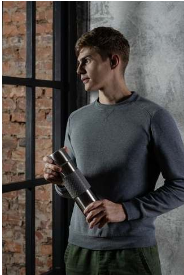
Термос Hard Work, 900 мл.

Двухслойная вакуумная конструкция из нержавеющей стали с завинчивающейся пробкой с клапаном. Силиконовая манжета для удобного захвата.